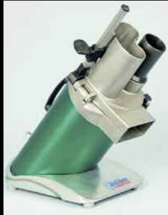
anliker Multicut 240: Ésta procesa hasta 500 kilos por hora. Ideal para empresas de catering, empresas de producción y otras empresas grandes de procesamiento de víveres.