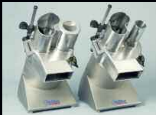
anliker Volume: La hermana grande de la anliker5 para cocinas grandes, cantinas y otras empresas de alimentación.